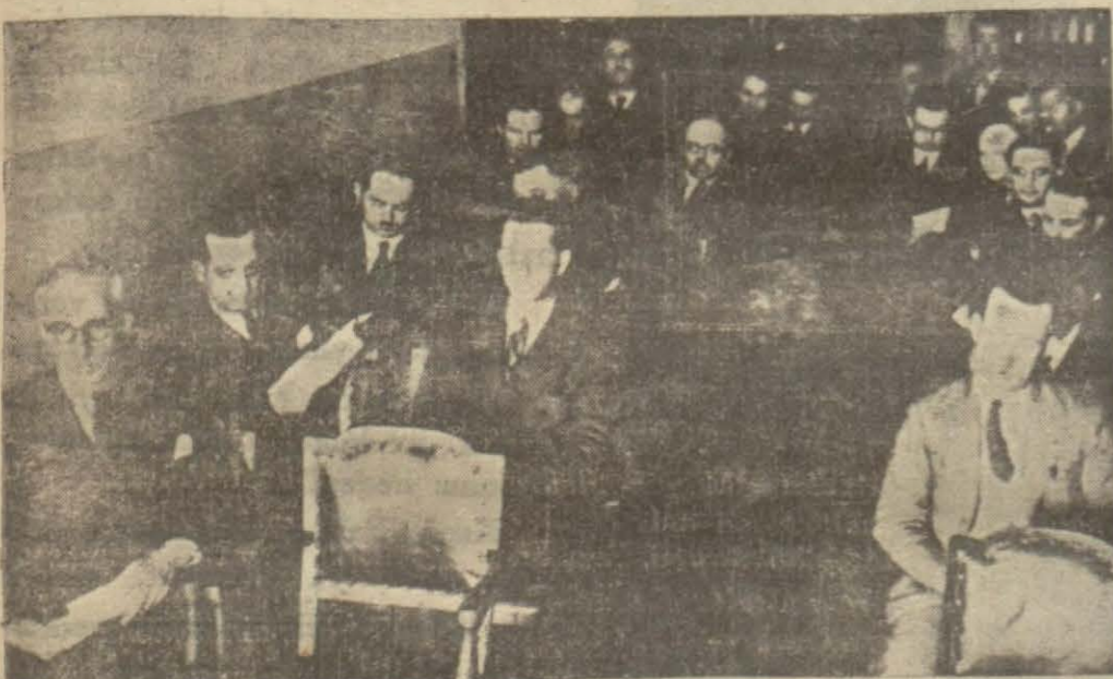
Dünkü toplantıdan bir görünüş

Marmara ve Trakya mintakası ticaret odaları kongresi dün şehrimiz ticaret odasında toplandı. Kongreye civar ticaret odalarından seçilen elli kadar murahhas iştirak etti.