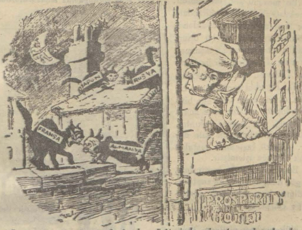
İngiltere — Böyle geceleyin dam üstlerinde miğavilayarak uyku kaçırınlar kimlerdir, bakayım?