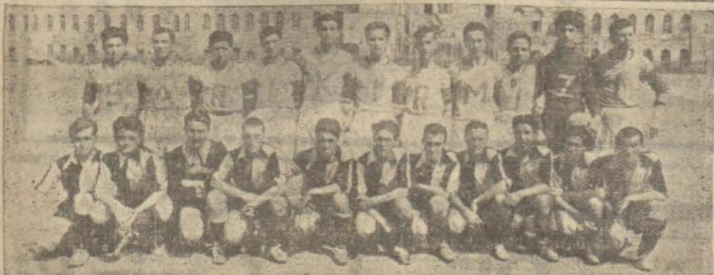
Galatasaray İstanbulspor atletleriyle sporcular

Dün Taksim stadında Galatasaray ve İstanbul liseleri talepleri arasında senelik atletizm ve futbol müsabakaları yapılmıştır. İki mektebin bini aşan talebesi huzurunda yapılan bu müsabakalar çok hararetlili olmuştur.