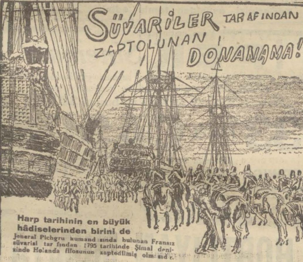
Harp tarihinin en büyük hadiselerinden birini de Jeneral Pichgru komandında bulunan Fransız süvarisi tarafından 1795 tarihinde Şimal denizinde Holanda filosunun zaptedilmiş olduğunu...