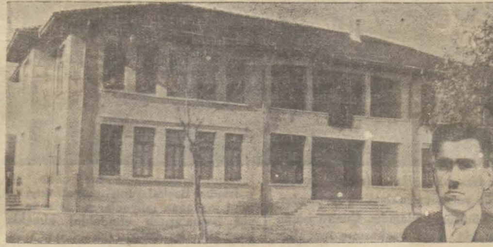
Nazilli Beş Eylül Mektebi ve maarif memuru Ahmet Bey

Nazilli (Hususi) — Nazilli Maarif hayatı hummalı bir faaliyet arz ediyor. Nazilli mntakası dahilinde (25) mektep vardır. Bunların yarısından fazlası üç sınıflı ve tek muallimlidir. Mevcut mekteplerde 63 muallim tarafından 2662 çocuk okutulmaktadır.