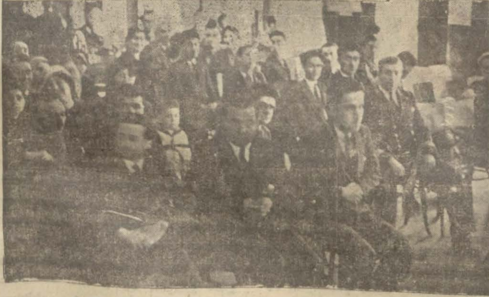
Dün Halkevinde verilen konferansın dinleyicileri

Dün Çocuk bayramına ikinci günüyü. Hava çok müsait olduğu için küçükler tam manasile eğlenebildiler. Mekteplerin tatil oluyundan istifade ederek kendi bayramlarını sevinçle kutladılar.